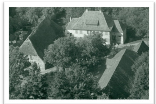
Luftaufnahme 1956 1