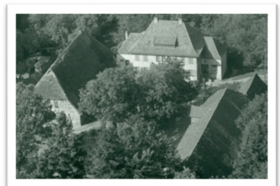
Luftaufnahme 1956 1