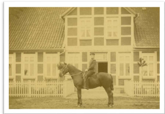
1890 wurde das jetzt noch stehende Wohnhaus erbaut