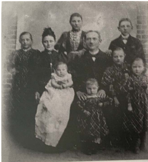
um 1897 Emma Heinrich Dorothee Dorothee Heinrich Emma Ella Frieda Anna