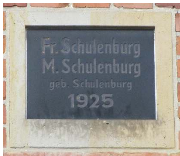
1925 Neubau des Hauses