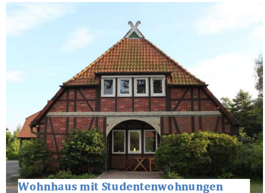
Wohnhaus mit Studentenwohnungen (etwa 2015)