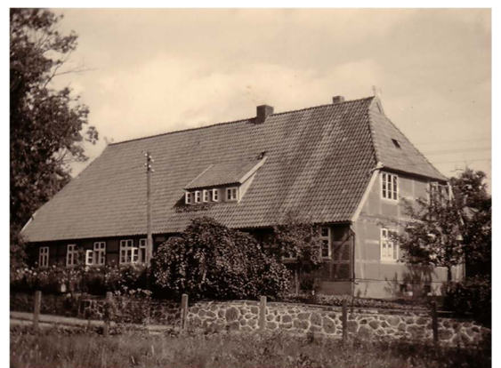
Wohnhaus (etwa 1960)