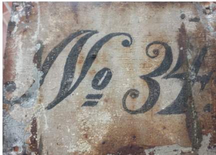
Die alte Hausnummer